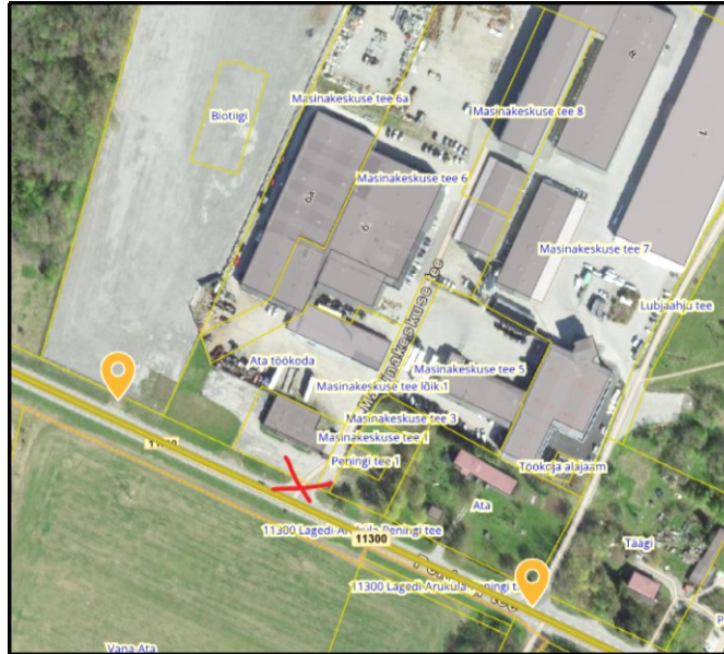
Joonis 7. Väljavõte Maa- ja Ruumiameti teeregistrist