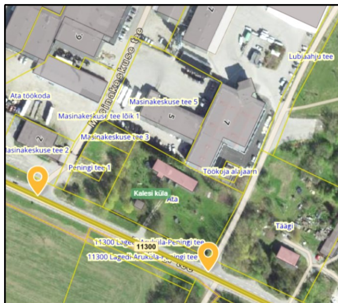
Joonis 6. Väljavõtte Maa- ja Ruumiameti teeregistrist

VARIANT 2: Olemasolev ristumiskoht riigitee km 12,853 likvideeritakse. Me ei nõustu selle ümbernimetamisega varu- ega tehnoloogiliseks mahasõiduks, sest arvestades ristmiku soodsaid parameetreid ja asukohta kompleksi keskmes ei ole piiratud kasutus realistlik ega mõistliku halduskoormusega järelevalvatav. Juurdepääsud planeeringualale kavandatakse km 12,994 (Lubjaahju tee nr 6510459) ja rajatava ristumiskoha riigitee ca km 12,745 kaudu (vt joonis 7 ).