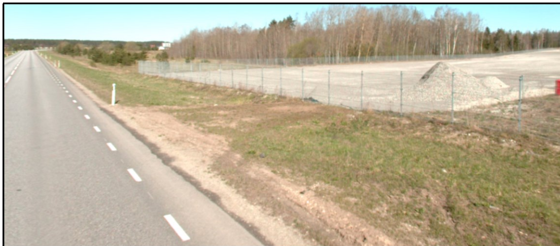
Joonis 4. Riigitee ristumiskoht 12,745 (teevideo aprill 2024)

planeeringualalt väljasõidul (vt joonis 1 ). Täna esitatud lahenduse jooniselt nähtuvad selgelt sõidusuundade tähistused (vt joonis 2 ).