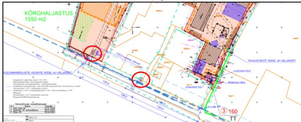
Joonis 3. Väljavõtte planeeringu põhijoonisest (esitatud märts 2025)

Korduvaks kooskõlastamiseks esitatud lahenduse jooniselt nähtuvad selgelt nimetatud ristumiskoha sõidusuundade tähistused (vt joonis 3 ).