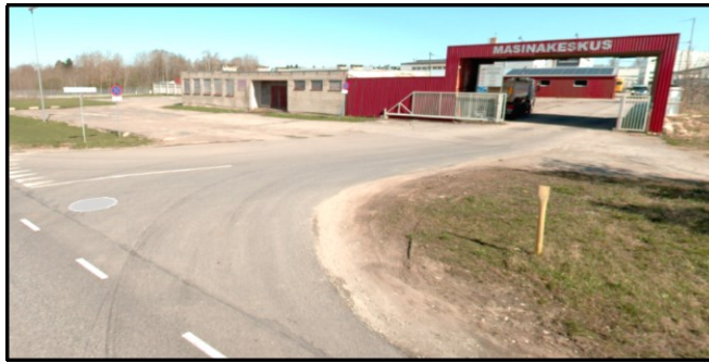
Joonis 1. Riigitee ristumiskoht km 12,853 (teevideo aprill 2024)

Planeerigu eelmise versiooni joonisel on selge viide, et tegemist on varujuurdepääsuga planeeringualale (evakuatsiooni puhul; vt joonis 2 ).